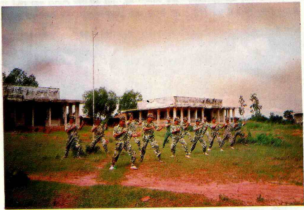
Giờ tập của Trung đội Đặc nhiệm - Đại đội 5 Đặc công Bình Thuận.