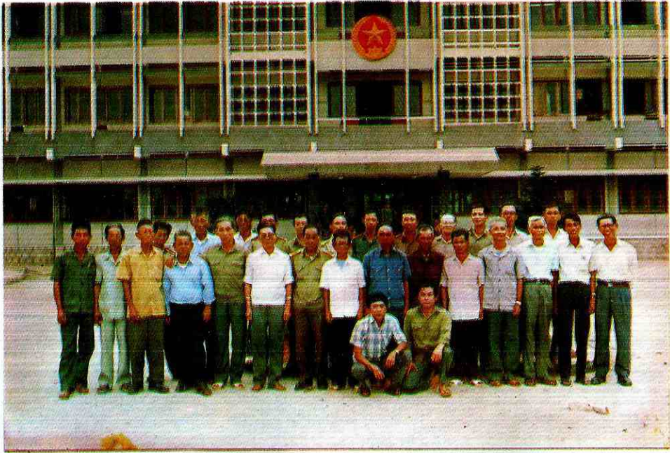
Các đại biểu dự Hội nghị thông qua Lịch sử đơn vị - Chụp ảnh lưu niệm trước nhà làm việc của Bộ Chỉ huy Quân sự Tỉnh Bình Thuận.