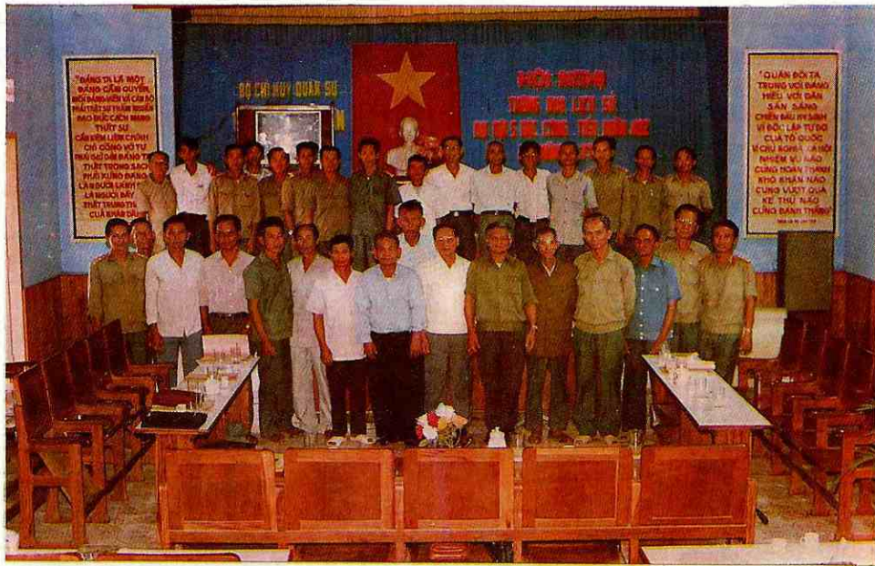
Đảng ủy - Bộ Chỉ huy Quân sự Bình Thuận tổ chức thông qua Lịch sử Đại đội 5 Đặc công, Tiểu đoàn 482, Đơn vị Anh hùng Lực lượng vũ trang nhân dân. (Lần thứ nhất)