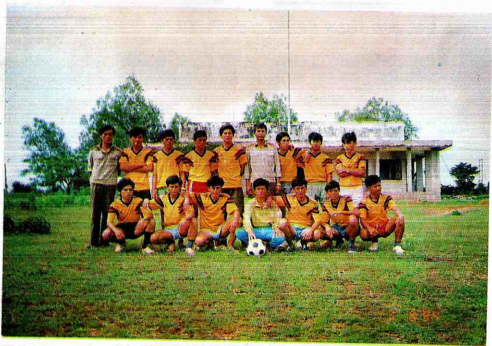
"Khỏe để công tác, chiến đấu". Đội bóng đá - Đại đội 5 Đặc công Bình Thuận luôn đạt giải cao trong các kỳ thi đấu chung kết bóng đá lực lượng vũ trang Tỉnh.